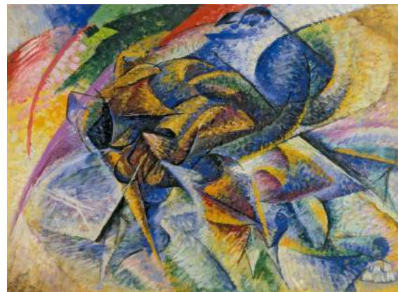
Dynamisme d'un cycliste Umberto Boccioni , 1913