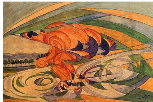
Cycliste Gerardo Dottori , 1916