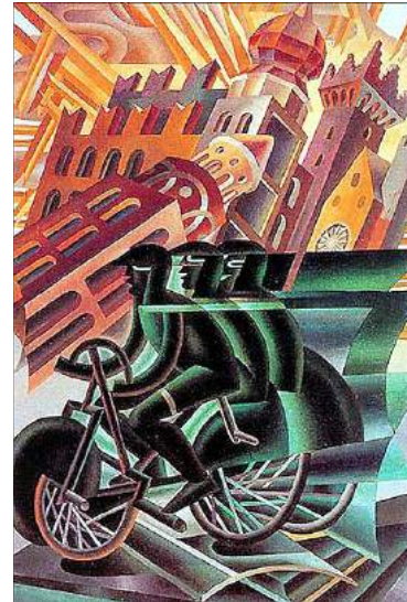
Le cycliste traverse la ville Fortunato Depero , 1945