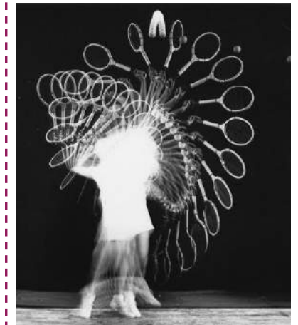
Tennis player Harold Edgerton, 1938

Etienne-Jules Marey invente la chronophotographie en 1882 pour décomposer les mouvements. Cette technique de prise de vue en rafale est encore utilisée de nos jours.