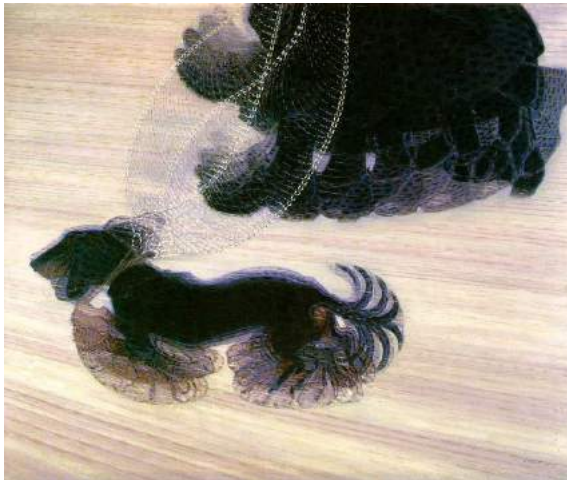
Dynamisme d'un chien en laisse Giacomo Balla , 1912