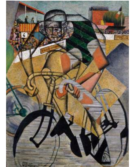
Au vélodrome Jean Metzinger , 1912