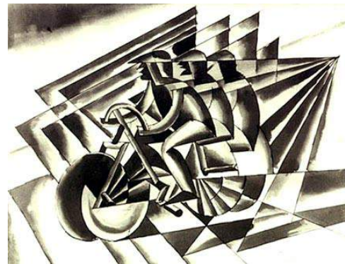
Cyclistes Fortunato Depero , 1923