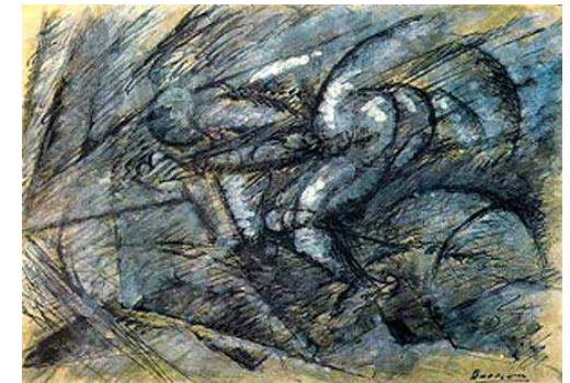
Dynamisme d'un cycliste Umberto Boccioni , 1913