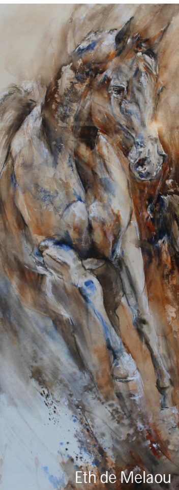
Eth de Melaou

Les EXTRABIENnales 2019 invitent les élèves de Haute-Loire à explorer le thème A vos pinceaux... prêts... peignez 🖌️